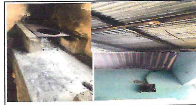
Foto 6: REPARACION DE SISTEMA ELECTRICO, SISTOTUCION DE PALNCHA DE METAL

Observación: Si es necesario se pueden agregar hojas adicionales y actualizar el número de hojas.