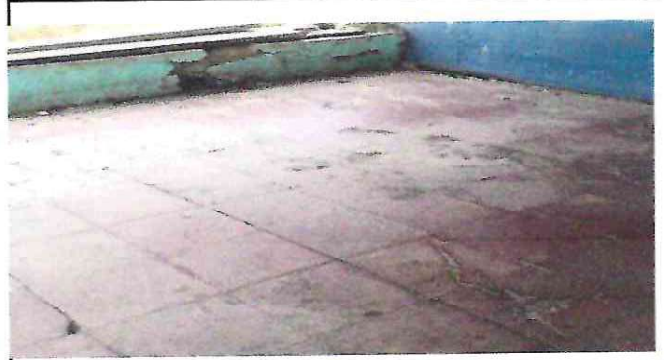
FOTO 2: SUSTITUCION DE PISO POR PISO DE GRANITO YA QUE SE ENCUENTRA MUY DETERIORADO.