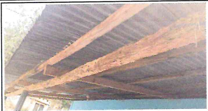
FOTO 1: CAMBIO DE LAMINA Y ESTRUCTURA METALICA EN SU TOTALIDA A LA COCINA Y CORREDORES YA QUE ESTA EN MAL ESTADO